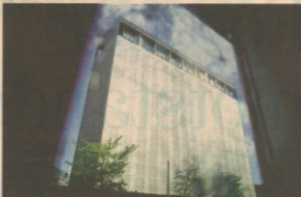
SYMBOLBYGG. Riksantikvar vil la Høyblokka bli stående.

OSLO: Riksantikvar Jørn Holme vil ikke rive, men restaurere og bevare, bygningene i regjeringskvartalet som ble ødelagt under 22. juli-terroren. «Høyblokka og Y-blokka er de viktigste symbolbygningene for den moderne norske velferdsstaten etter krigen. De er typiske for sin tid, men samtidig unike, skriver riksantikvaren i en pressemelding. Han poengterer at det er fullt mulig å finne ny bruk av bygningene og at det sannsynligvis vil lønne seg samfunnsøkonomisk å bevare bygningene fremfor å rive dem og bygge nytt. «Høyblokka og Y-blokkaas hovedkonstruksjon og kunst er ikke skadet etter terrorangrepet», skriver kulturministeren. Han mener bygningene kan restaureres til velfungerende, sikre og representative kontorlokaler med universell tilgjengelighet. Riksantikvaren poengterer også at han mener kostnadbe-